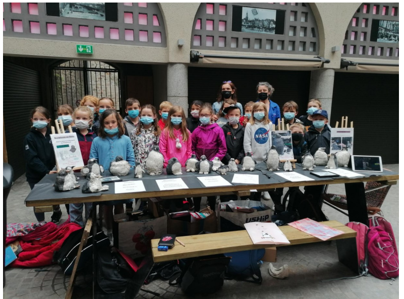
Pendant une semaine, dans les Halles de Dinan, face à la galerie d' Art de N.Leroy-Daniel, les réalisations des CE2 étaient exposées.

Ils ont pu ramener leur précieuse sculpture jusqu'à Planguenoual.