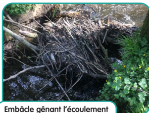
Embâcle gênant l'écoulement (à retirer)