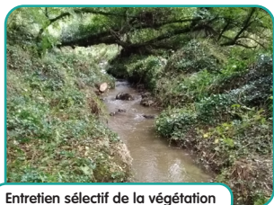
Entretien sélectif de la végétation