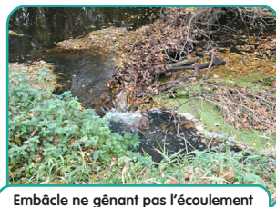
Embâcle ne gênant pas l'écoulement (à laisser)

Attention : L'entretien des cours d'eau est autorisé du 1 er avril au 31 octobre.