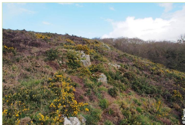
Landes à Ajonc maritime (habitat d'intérêt communautaire)

Mais, en réalité, il inclut aussi la communauté des êtres vivants qui, par leur adaptation à ce milieu, s'y développent et le façonnent. C'est pourquoi, par extension, l'habitat est souvent décrit par le type de végétation qu'on y trouve. Des radeaux de Nénuphar accompagnés de Potamot et de Rubanier indiquent par exemple des eaux moyennement profondes, plutôt stagnantes et assez riches en nutriments.