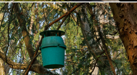
Piège à phéromone