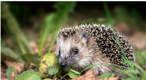
Petite faune des villes