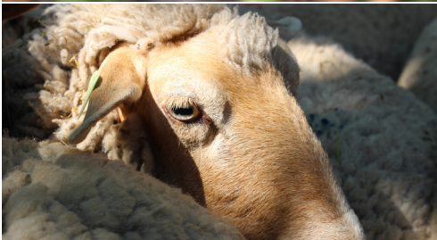
Tonte de moutons avec la méthode Bowen