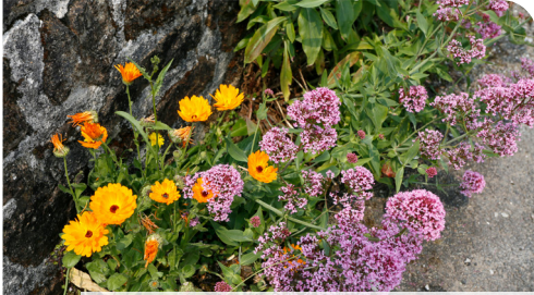
Plantes sauvages en pied de mur