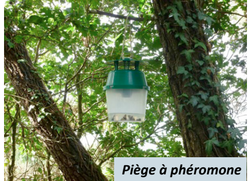
Piège à phéromone

Le piège à phéromone va permettre la capture des papillons mâles (stade «adulte» de la chenille) à l'aide de phéromones de synthèse.