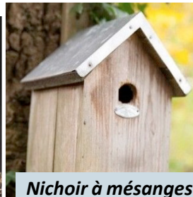
Nichoir à mésanges